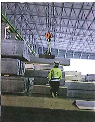
TAK. Det er nå lagt tak over det store lagerområdet.

Kynningsrud ble etablert i 1946 og omfatter i dag virksomheter innenfor forretningsområdene Prefab, Fundamentering, Eiendom og Kran. Sistnevnte skjer gjennom satsingen Nordic Crane Group (Skandinavias største kranselskap), som Kynningsrud Holding og TS Eiendom eier 50 prosent hver. Totalt har Kynningsrudgruppen ca 300 ansatte og omsetter for ca 800 mill norske kroner.