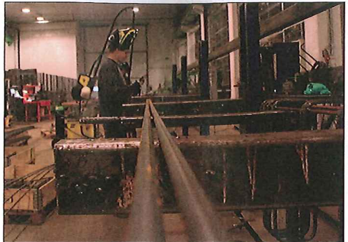
ARMERING. Det går med mange tonn armeringsjern i løpet av et produksjonsår.