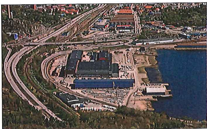
OMFATTENDE. I 2006 kjøpte Kynningsrud tomten og lokalene på Kasen av Uddevalla kommune. Anlegget består av lokaler på nærmere 30.000 kvadratmeter og de har rundt 80 mål tilgjengelig tomteområde.

Nylig feiret Kynningsrud Prefab sine første 15 år i virke, og kan se tilbake på en god utvikling. Samtidig rustet selskapet opp for videre vekst både i Norge og Sverige.